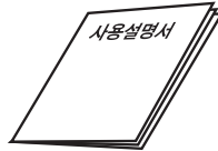
1. 사용 설명서