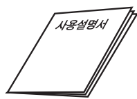
1. 사용 설명서